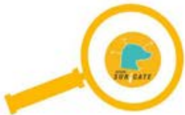
Retours de terrain