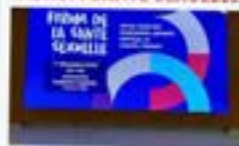
FORUM SANTÉ SEXUELLE