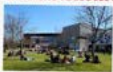
UNIVERSITÉ TOULOUSE 2