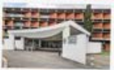
UNIVERSITÉ TOULOUSE 1