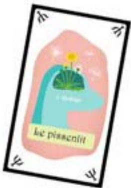
Oracle - cartes expression -