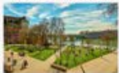
QUAI DE LA DAURADE